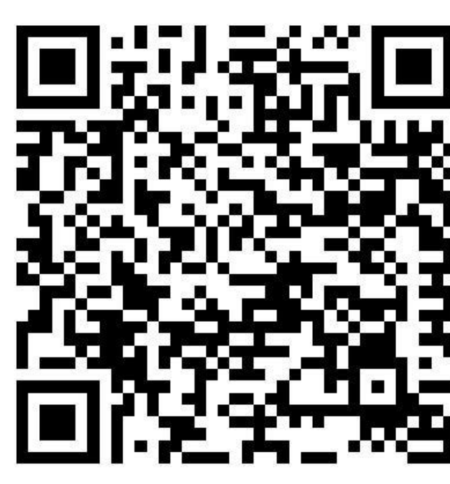
**Corona-Regelungen in den Bundesländern

Hotlines zum neuen Coronavirus Bundesministerium für Gesundheit: 030 346 465 100 Unabhängige Patientenberatung Deutschland: 0800 0117722 Patientenservice: 116 117