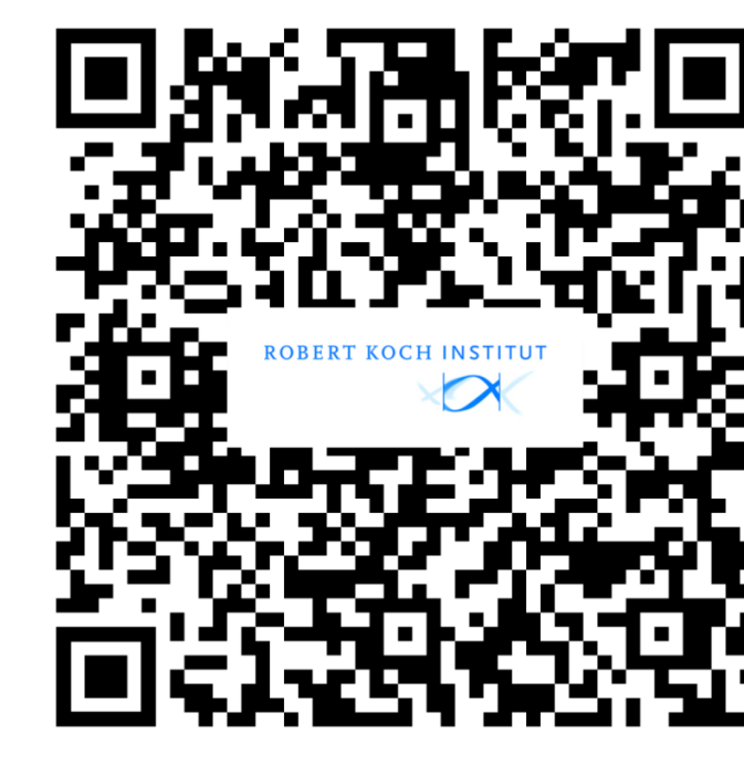
Weitere Informationen RKI