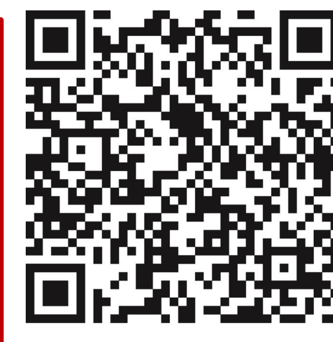
Weitere Informationen BZgA

Hotlines zum neuen Coronavirus Bundesministerium für Gesundheit: 030 346 465 100 Unabhängige Patientenberatung Deutschland: 0800 0117722 Patientenservice: 116 117