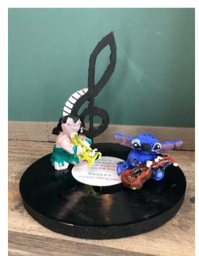
Notensulptur zur Wettbewerbsteilnahme.

In der nun abgeschlossenen Reihe zur Erlenbachschule haben wir Ihnen die Schule vorgestellt, wie sie ohne Corona geplant ist und funktioniert. Seit über einem Jahr arbeiten und leben wir alle in einer Ausnahmesituation. Eine schwierige Zeit für alle: für Kinder und Eltern, für Lehrerinnen und Lehrer. Wir alle geben und ermöglichen das Beste: Die Eltern unterstützen ihre Kinder beim Lernen zuhause, obwohl sie selbst großen Belastungen ausgesetzt sind, die Kinder lernen, obwohl sie ihre Freundinnen und Freunde vermissen, die Lehrkräfte unterrichten online, obwohl die Bedingungen dafür erst geschaffen werden mussten. Ein Dank gilt auch all denen, die neue Technik zur Verfügung gestellt und Fortbildung ermöglicht haben.